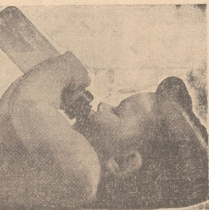
LO QUE SUGIERE EL CHUPO.—El niño, reflexionando mientras chupa.